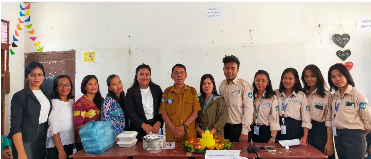
Gambar 3: Tempat Kegiatan Pelatihan