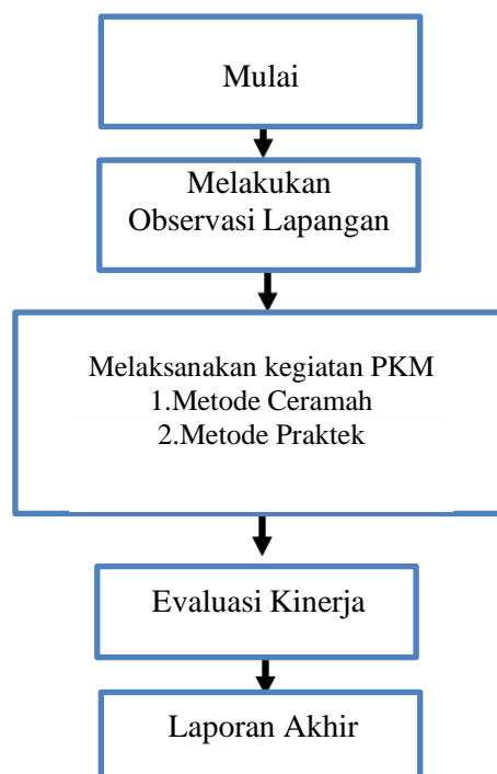
Gambar 1 : Tahap Pelaksanaan Kegiatan

Adapun mekanisme pelaksanaan kegiatan yang dilakukan agar solusi yang ditawarkan dapat disalurkan dengan baik kepada mitra sesuai yang diharapkan dilakukan melalui tahapan-tahapan. Dalam melaksanakan kegiatan PKM Digitalpreneur Desain Grafis di CV. Inti Grafika mengikut beberapa prosedur mulai dari proses analisis situasi sampai dengan penutupan pelaksanaan, untuk memperjelas diuraikan pada proses berikut ini: