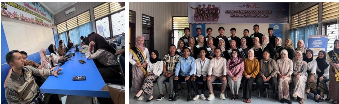
Gambar 4 : Dokumentasi kegiatan Penutan dan Evaluasi