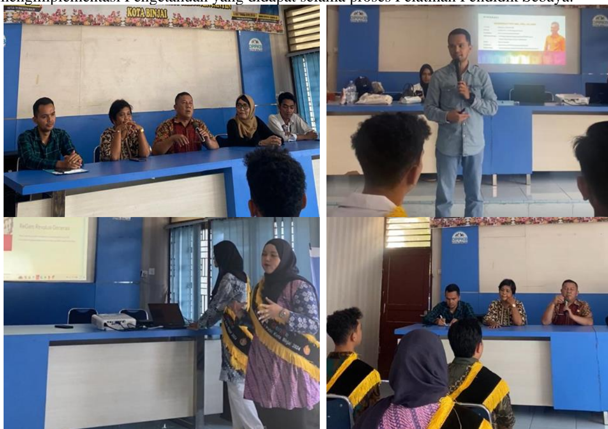
Gambar 3 : Dokumentasi Penyampaian Materi bagi Peserta

Program pembentukan pendidik sebaya melalui kegiatan pelatihan dan pendampingan ini tidak menunjukkan dampak positif pada remaja. Hasil ini didukung dengan temuan penelitian yang dilakukan oleh Afriyanti, dkk (2019) yang menunjukkan bahwa pendidik sebaya mampu meningkatkan pengetahuan yang positif bagi teman sebayanya serta mengajak mereka untuk bersama-sama menjadikan lingkungan berada menjadi lingkungan sehat. Selain itu, keberhasilan program Pelatihan Pendidik Sebaya ini tidak lepas dari dukungan penuh dari pihak mitra serta kolaborasi Tim Pengabdian dengan Peserta kegiatan. Rekomendasi Tim Pengabdian kepada pihak mitra agar kegiatan ini dapat diteruskan dan rutin untuk memotivasi remaja khususnya yang bergabung dalam Forum GenRe Kota Binjai agar mampu dan mau mengimplementasi Pengetahuan yang didapat selama proses Pelatihan Pendidik Sebaya.