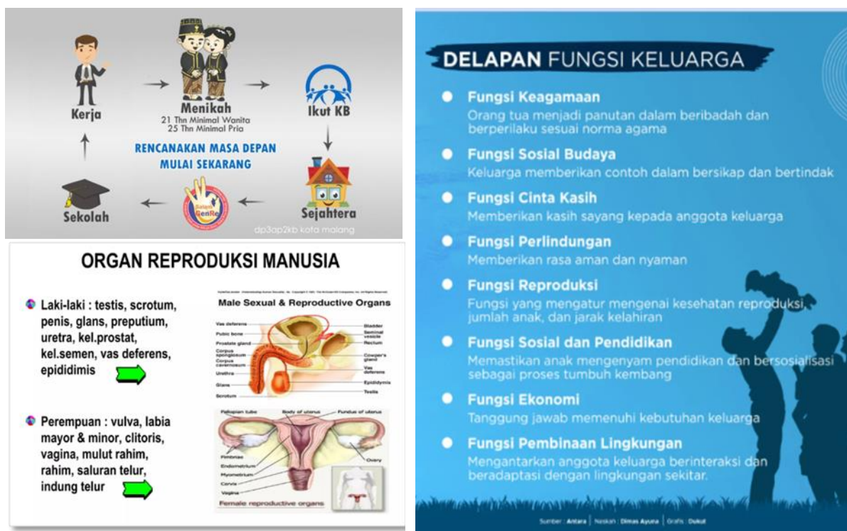
Gambar 2 : Cuplikan Materi Inti Pelatihan Pendidik Sebaya